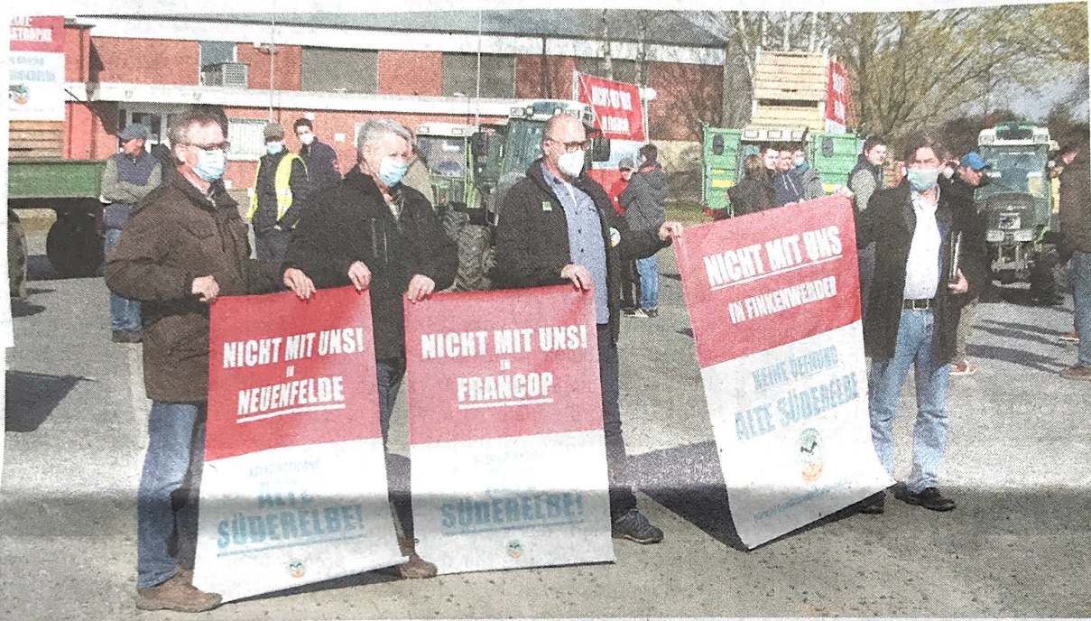
Vor einem Jahr fand die vorerst letzte große Demonstration (hier beim Start in Neuenfelde) gegen die Öffnung der Alten Süderelbe statt

„Bürgerschaft könnte ein schnell ein Ende machen“